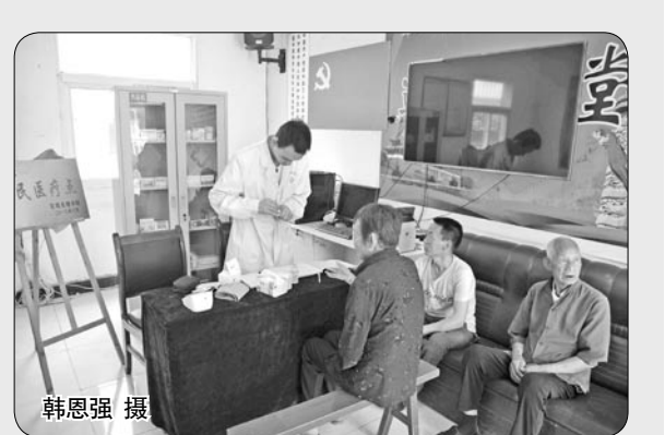
我校在千阳县“两联一包”帮扶村水沟镇纸房沟村建起“惠民医疗点”,免费为村民提供卫生保健服务,受到群众的欢迎和赞誉。