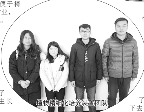
植物精细化培养装置团队

要原因就是坚持,因为大家都很忙,如果没有坚持的信念,可能早就散了,也不会有今天的成就,当然也要感谢老师的帮助。”