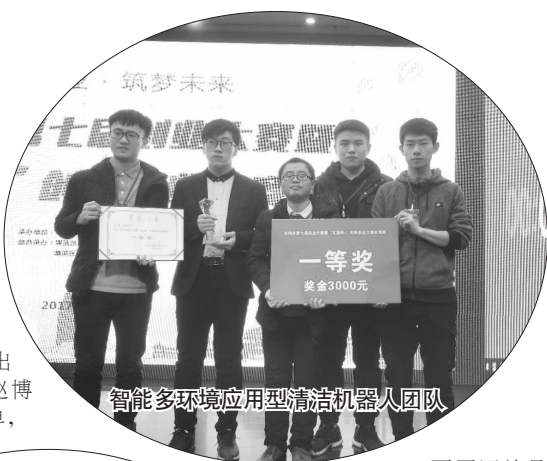
智能多环境应用型清洁机器人团队

他们的设计初衷是为了某些常年在外出差,不能经常回家,却又喜欢养一些花草草的人,这样就可以不用担心花草疏于管理而枯萎。其实他们经历的困难很多,首先就是电路板的绘制,由于不是自己的专业,学起来很是困难,再就是团队的内部的一些分歧,但是最重要的就是能够坚持。他们的带队老师最欣赏的就是这一点,为了自己的梦想可以不断前行,不怕艰难困苦,这才是他们成功的主要原因。“我觉得我们这个团队能够成功的主